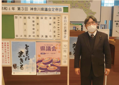
令和4年度第3回神奈川県議会定例会