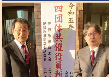
伊勢原市商工4団体共催による新春の集い