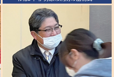
市民のみなさまへ早朝のご挨拶