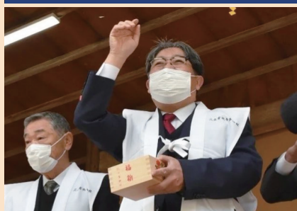
延喜式内相模三宮比々多神社節分追儺祭