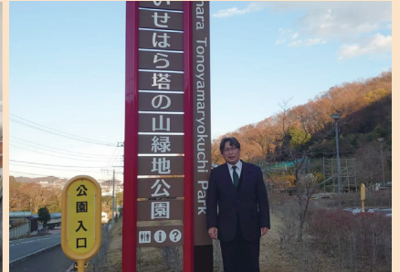
県立塔の山緑地公園へ看板設置