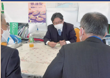
来訪者も大勢お越しいただいています