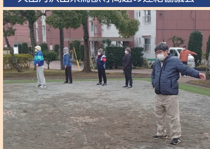
「未病の改善」のためにラジオ体操へ参加