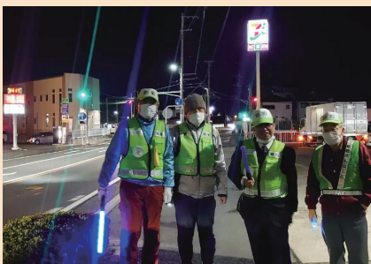
下大竹での自治会防犯パトロール