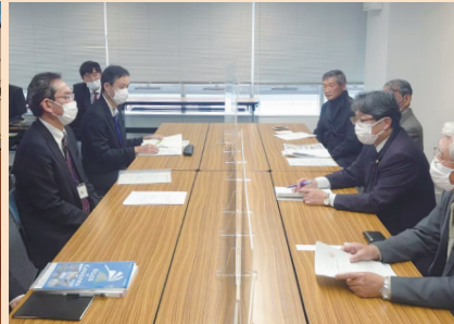
高部屋地区県道603号、県土整備局長に直談判