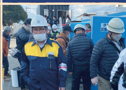
伊勢原南地区防災訓練