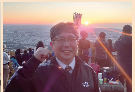
伊勢原市聖峰不動尊にて元旦初日の出