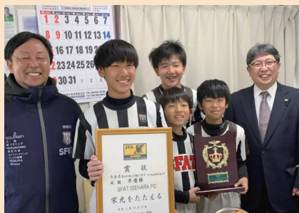
サッカー少年チームの訪問