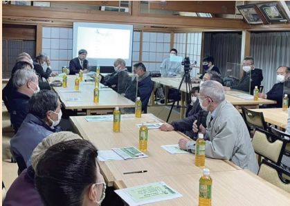
大山地区での県政報告会