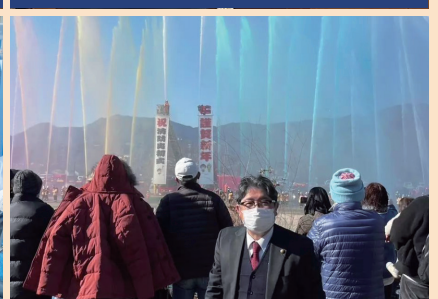
令和5年 伊勢原市消防の出初式