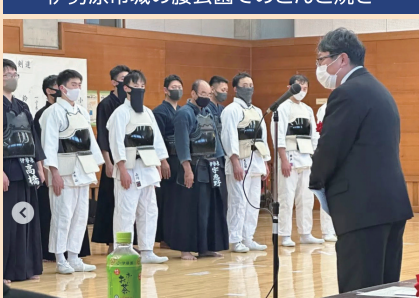
令和5年 伊勢原警察署での武道始式