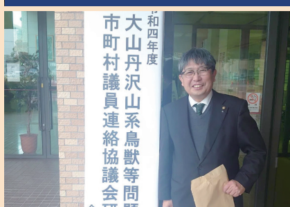
大山丹沢山系鳥獣等問題の連絡協議会