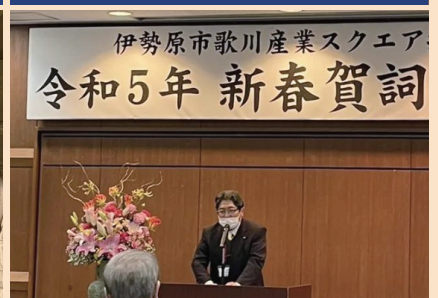
伊勢原市歌川産業スクエア 令和5年新春賀詞