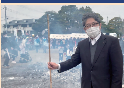
伊勢原市城の腰公園でのどんど焼き