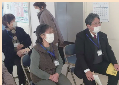
伊勢原市岡崎で開催された健康ミニサロン